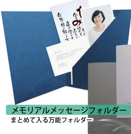
メモリアルメッセージフォルダー まとめて入る万能フォルダー