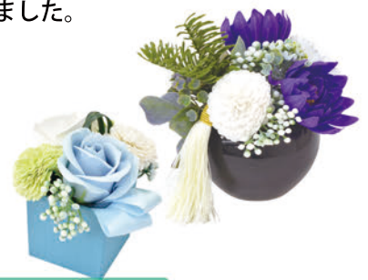
シャボンフラワー 弔電とセットで販売・提案「プラスワン商品」