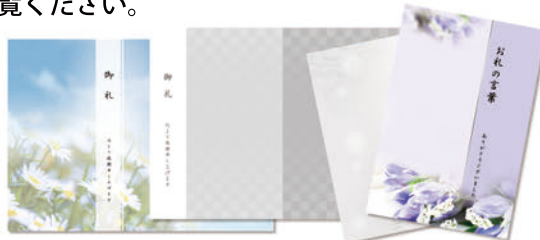
会葬礼状・ご葬儀報告はがき 会葬御礼や訃報連絡・ご葬儀報告として