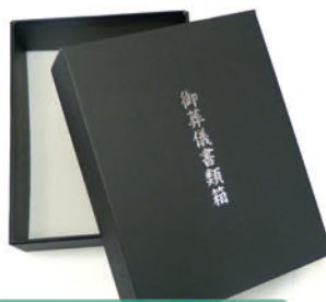
スタンダード書類箱 香典や記帳カードなどの保管に