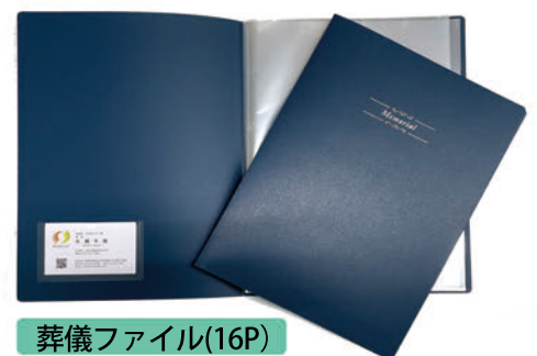
葬儀ファイル(16P) 事前相談や葬儀後の書類のお渡しに最適